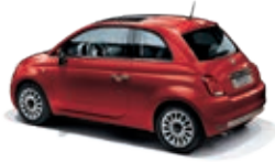
111 Passione Rot