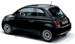
876 Vesuvio Schwarz