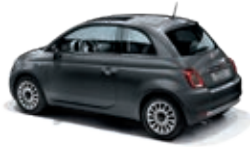
695 Pompei Grau