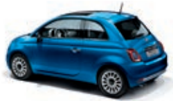
425 Italia Blau