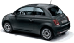
735 Carrara Grau