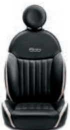
Leder Schwarz/Elfenbein 686/687